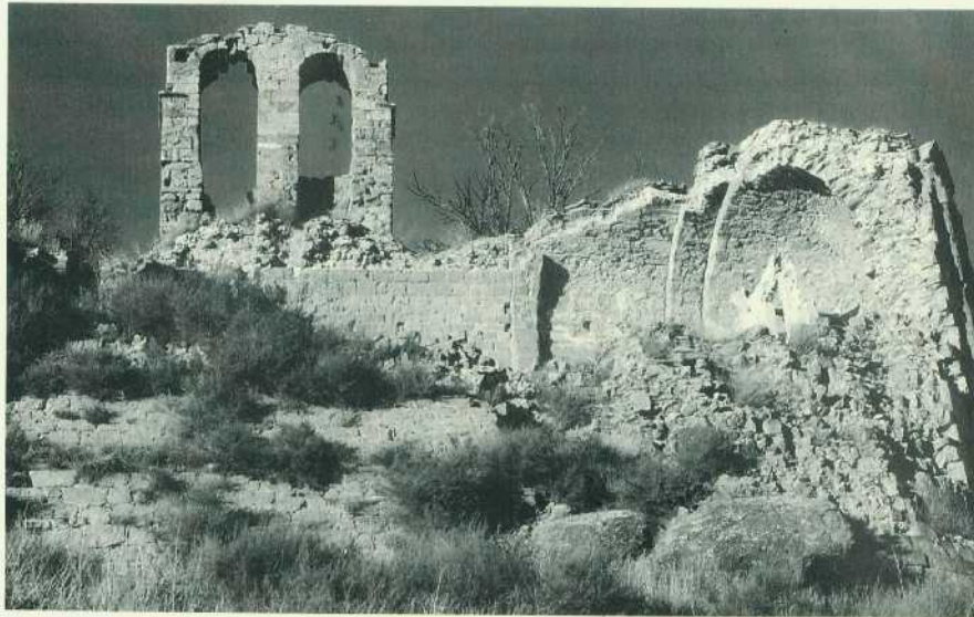
Església de Sant Pere de Madrona, 31 d'octubre de 1998.

No s'hi diu que la causa de la construcció d'una nova església fos el mal estat de l'antiga, que tampoc no es manifestava que resultés petita. Era, com s'ha vist, "molt incòmoda e inconvenient als parroquians", mentre la nova seria "més proporcionada y de millor disposició". Així i tot, les proporcions del nou edifici fan evident que es volgué disposar d'un temple molt més ampli. Hauriem de conèixer el nombre d'habitants de Madrona a la segona meitat del segle XII per a valorar més ajustadament si l'església, passades sis centúries, resultava petita. Però durant el segle XVIII Madrona va passar de 105 habitants (1718) a 208 (1787). Malgrat els dubtes d'aquestes xifres, és indiscutible que el creixement fou ben remarcable i que era ben percebut pels coetanis. Al costat d'això, no s'entendria d'haver-se embarcat a construir un nou edifici tan costós, pagat pels habitants de Madrona, directament o bé indirecta, sense la bonança econòmica que vivia a la ruralia el sector pagès més benestant. J. Benet (1904) inclogué Madrona entre les esglésies de nova planta bastides a sol·licitud de fra Rafael Lasala, un bisbe construc-