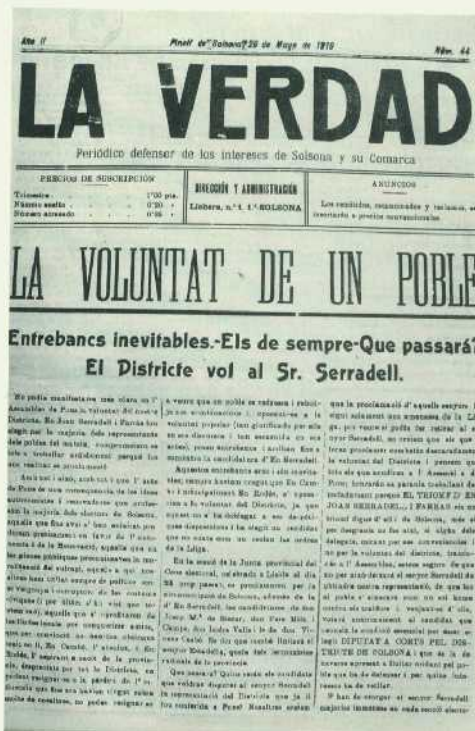
Diari La Verdad , núm. 44 de l'any 1919.

Des de la seva posada en funcionament, l'ACS ha fet un gran esforç per intentar aplegar el major nombre possible de revistes, diaris o butlletins. En l'actualitat compta amb 53 capçaleres de diferents publicacions de la comarca. La col·laboració de moltes persones ha estat i és un element fonamental en aquest procés destinat a completar l'Hemeroteca de l'Arxiu.