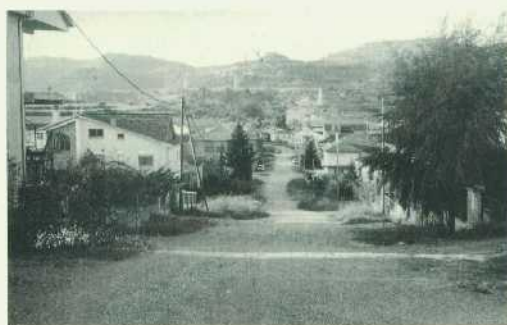
Sant Bernat, 17 d'octubre de 1996.