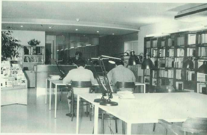
Sala de consulta de l'ACS.

SELGA i UBACH, Simeó. L'actuació del Gremi de Sant Lluc en la qüestió del solar de l'Església de Sant Miquel de Manresa, l'any 1952. Nadala 1997 . Manresa: Simeó Selga, 1997. 30 pàg.