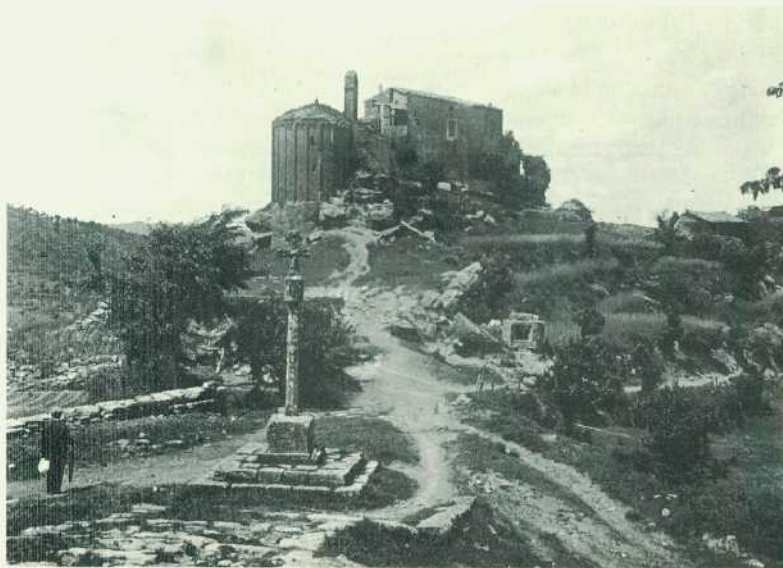
Església de Sant Pere de Madrona l'any 1913.