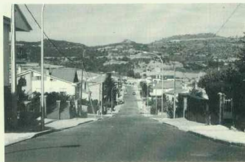
Sant Bernat, 31 d'octubre de 1998.