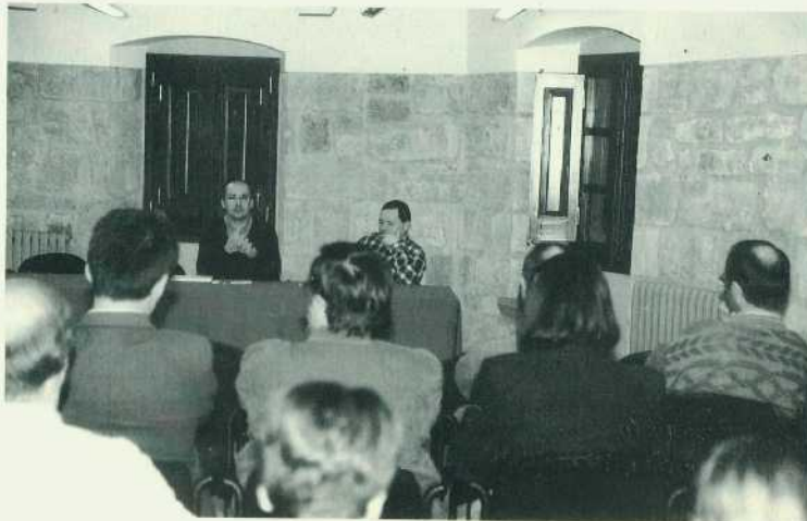
Conferència "Catalunya i el 98". Foto Resol