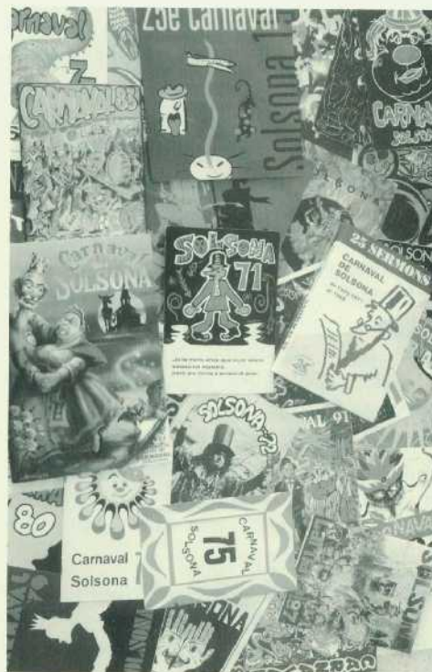
Impresos del Carnaval de Solsona.