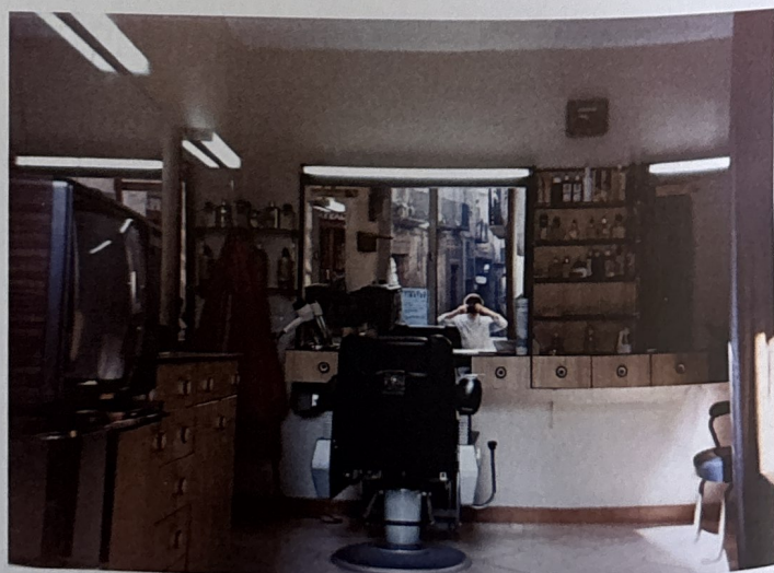
Interior de la "barberia del Puiggalí", a la plaça del Ruc